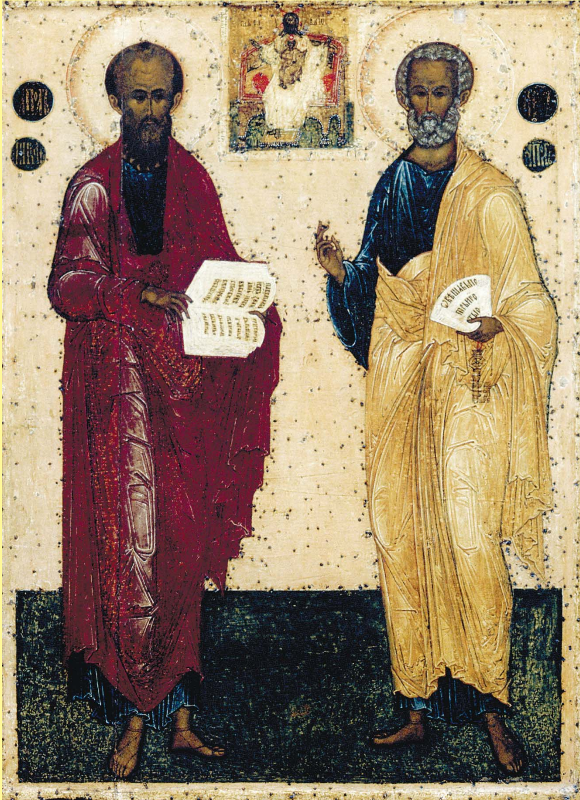
Верховные апостолы Петр и Павел. XVI век

"На асао воссоздания Святой Руси никакого специального благословения не надо. Бы и так имеем его внутри себя." Митрополит Волод (Сысцев).