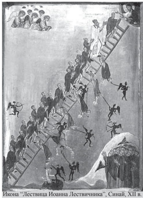
Икона «Лестница Иоанна Лествичника», Синай, XII в.