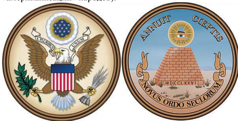
Лицевая и оборотная стороны «великой печати Соединенных Штатов»

своего», и «волшебством ее введены они в заблуждение» (это об «американизации» народов).